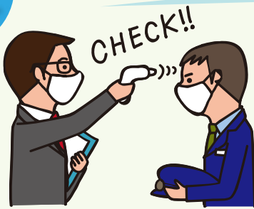
乗務員の体温をチェックしています